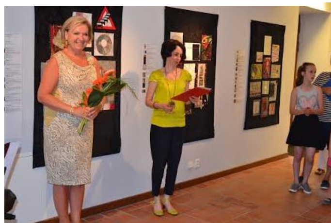
Zahájení výstavy v Jindřichově Hradci