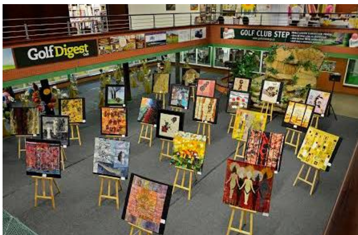
Prague Patchwork Meeting