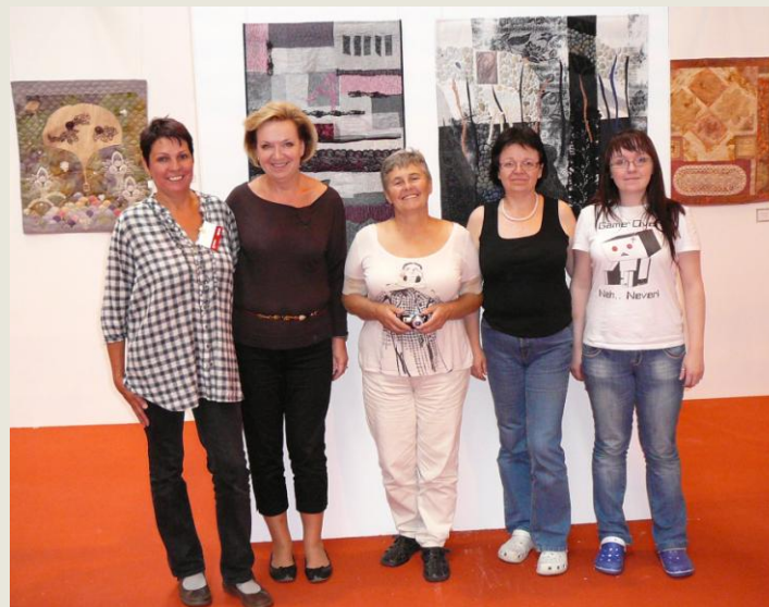
Prague Patchwork Meeting na Festival of quilts, Birmingham, 2011