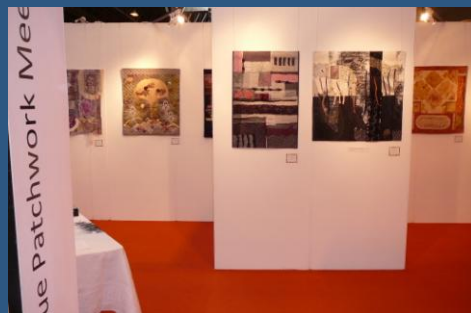
Expozice Prague Patchwork Meeting na Festival of Quilts, Birmingham, 2011