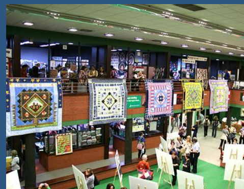
5. ročník Prague Patchwork Meeting

Více fotografií z výstavy najdete na našich webových stránkách.