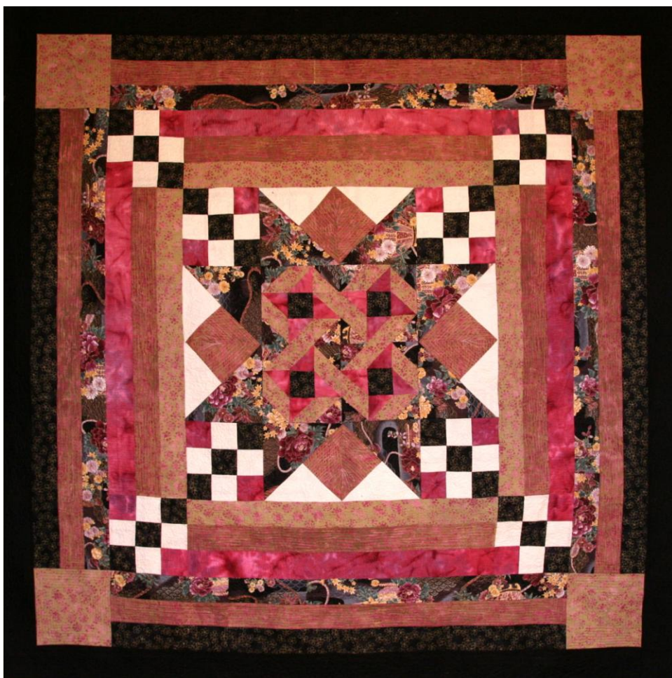
Czech Star Mystery Quilt, Anna Štěrbová