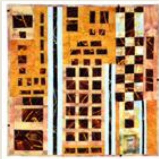
Monique Gilbert, Ztracené dveře (Lost Door), 100x100 cm