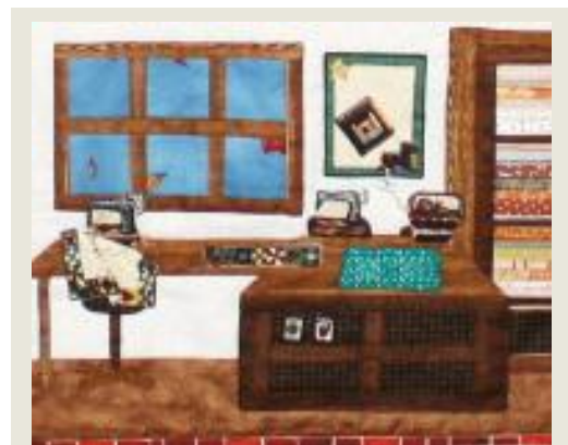
Domeček, Danuše Březinová (detail)

8. ročník výstavy patchworku ve Fulneku se koná 17. -19. 6. 2011.