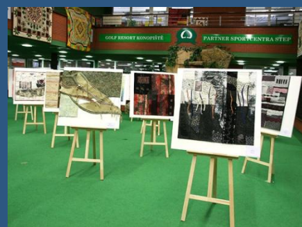
5. ročník Prague Patchwork Meeting

Více fotografií z výstavy najdete na našich webových stránkách.