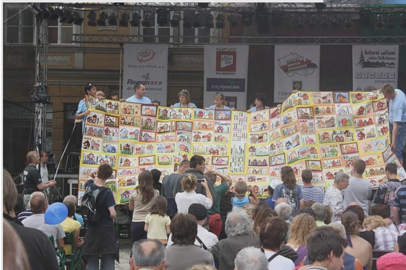
Fotografie převzaty z webu www.patchwork-cz.com Autor: Danuše Březinová