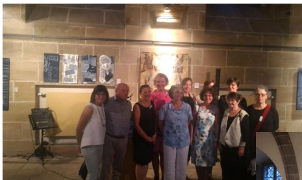
Výstava v Norimberku