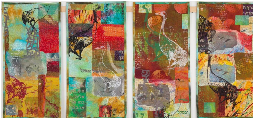
Bella Kaplan, Crains

Portréty autorů a charakteristiky galerií začne od podzimu přinášet i měsíčník Newsletter PPM, který je na našem webu volně ke stažení.