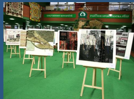
5. ročník Prague Patchwork Meeting

Více fotografií z výstavy najdete na našich webových stránkách.