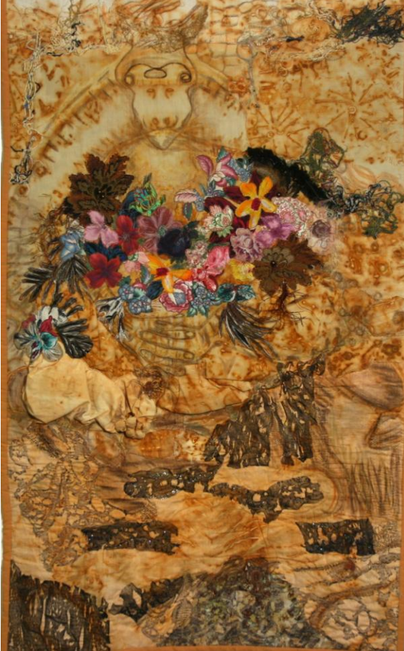
Helena Fikejzová. Tajemná zahrada

Téma zahrady je pro mě inspirací už od raného dětství. Na naší zahradě jsme s kamarády prožívali spoustu dobrodružství, stala se zahradou zámeckou, indiánským územím, kuchyní i nemocnicí, nevyčerpatelnou zásobárnou nápadů. Kohokoli jsem kdy navštívila, vždy mě nejvíce zajímala neznámá zahrada, se kterou jsem se chtěla detailně seznámit.