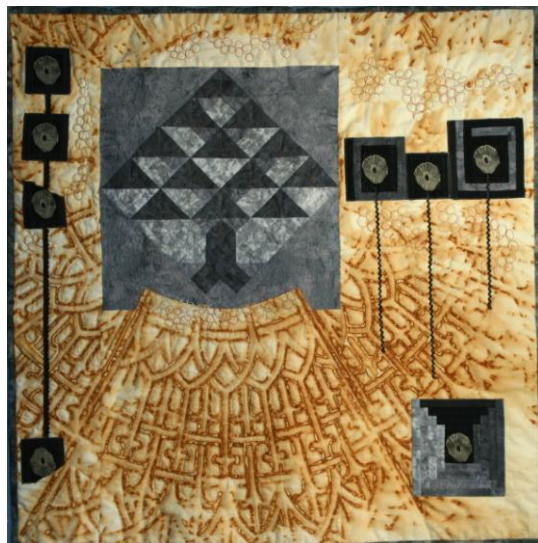
Olga Hořavová, Strom ve městě